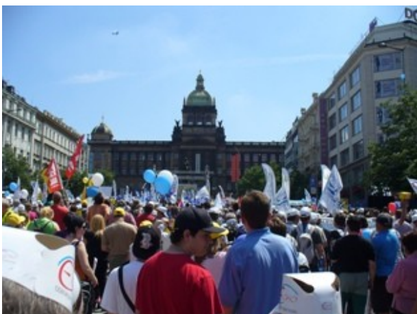
Z demonstrace, konané v sobotu 21. května v Praze