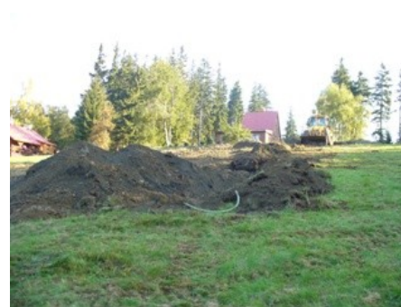
Zemní práce v okolí chaty

trické energie a ušetřit tak značné finanční prostředky POO vynakládané na provoz chaty. Pokud bude vše probíhat bez komplikací, tato akce by měla být ukončena na konci listopadu.