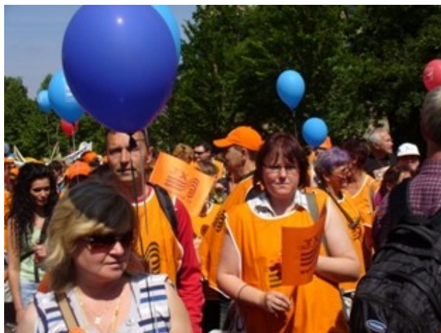
Protestující odboráři z naší POO