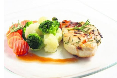
Třeba se taky jednou dočkáme

by se měla změna projevit do čtrnácti dnů, tedy asi do poloviny měsíce října. Pokud budete i nadále s obědy nespokojeni, bylo by dobré svoje připomínky zapsat do Knihy přání a připomínek okamžitě, pak lze stížnosti ze strany vedoucí jídelny konstruktivně řešit.