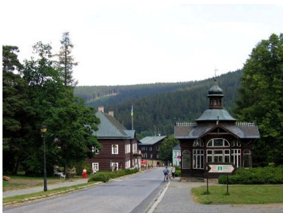
Pohled na lázeňské městečko Karlova Studánka

Opět se pokusíme vybrat nějakou atraktivní a neokoukanou lokalitu.