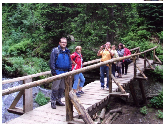
Naučná stezka Údolím Bílé Opavy - překrásná náročnější trasa, dlouhá asi 9 km