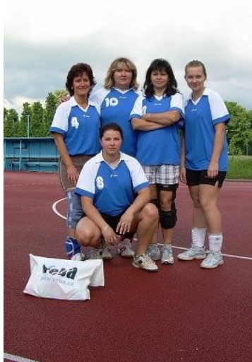
Vítězné družstvo našich volejbalistek