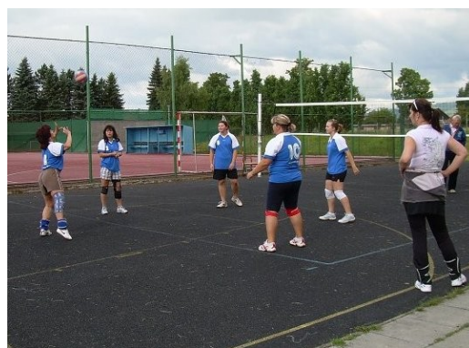
Volejbalistky v akci