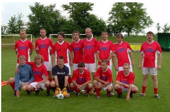
Naši fotbalisté vybojovali krásné třetí místo

hotelu. To se opravdu vyplatilo. Volejbalistky opět nezklamaly, i letos odjely neporaženy. Naši fotbalisté obsadili pěkné třetí místo. Oběma týmům děkuji za výbornou reprezentaci POO Veba.